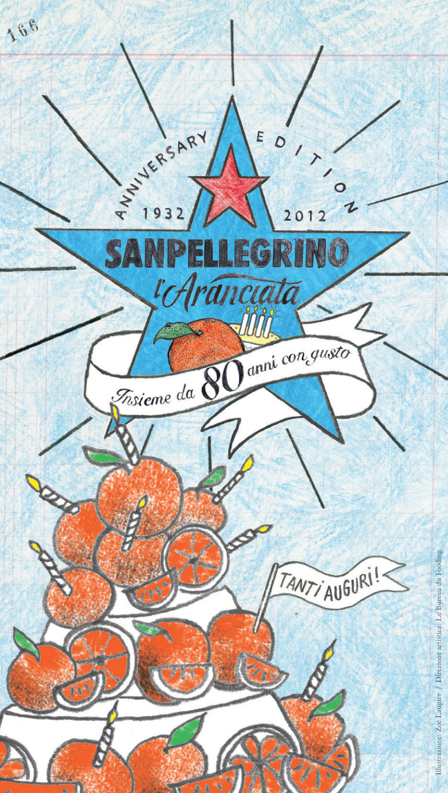
Illustrazione: Zoe Laugier / Direzione artistica: Le Bureau du Fooding