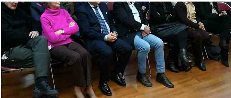
Enologia a Monaco: nel pubblico, al centro, S.E. Cristiano Gallo, Ambasciatore d'Italia a Monaco

"Il vino è una delle cose più civilizzate al mondo" . A queste conclusioni era giunto lo scrittore americano Ernest Hemingway nel constatare che il prodotto finale della lunga e complessa filiera della vite ha da sempre rappresentato un elemento prezioso, e in un certo senso altamente "simbolico", e per questo spesso associato al concetto stesso di "perfezione divina". Dietro ad un "semplice" bicchiere di vino, infatti, si cela un mondo di tradizione, passione e ricerca. I profumi che compongono il suo bouquet e ne determinano l'intensità. Le sensazioni che ne derivano e che lo rendono più o meno complesso. Colore, aroma, gusto e vista. Questa nobile bevanda è in grado di stimolare tutti i nostri sensi.