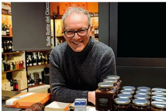
Sulle Rotte del Crocco