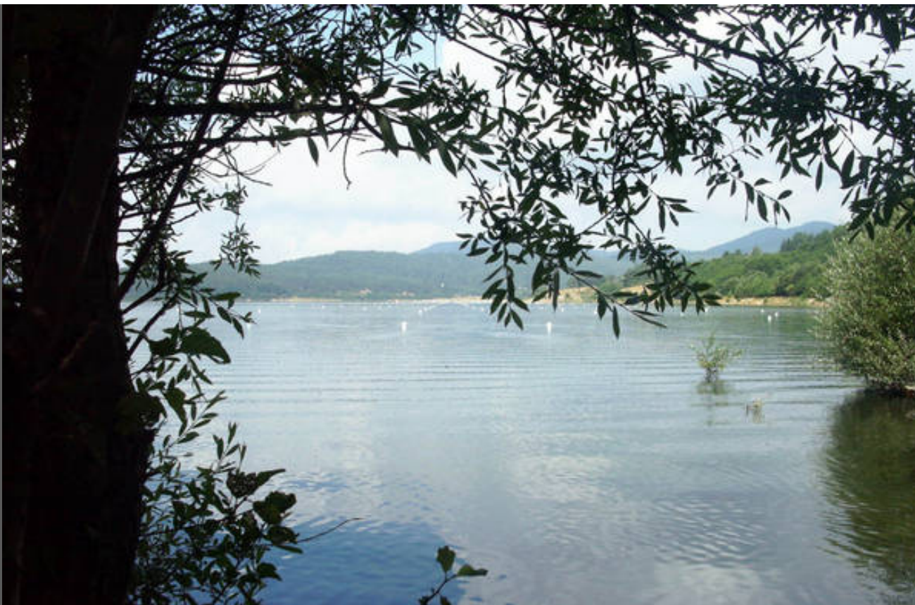
Parco della Sila